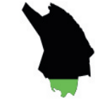
PARC LA VILLETTE 550 daa (Paris)