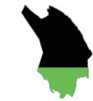
HYDE PARK 1 400 daa (London)