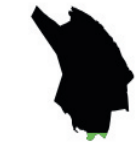
NYGÅRDSPARKEN 72 daa (Bergen)